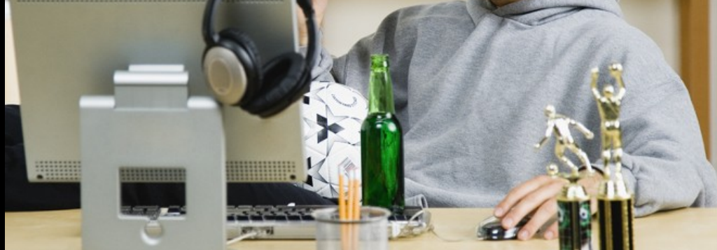
Gracz przed komputerem, foto: Glow Images/East News

na siedząco, stojąco i leżąco, czyli jak ucząc się, polscy studenci niszą swoje kręgosłupy - materiał Martyny Ogonek (Czwórka/4 do 4)